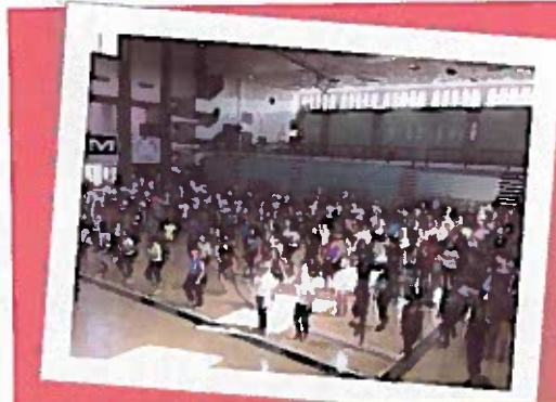
Zumbate pa' Maniquel