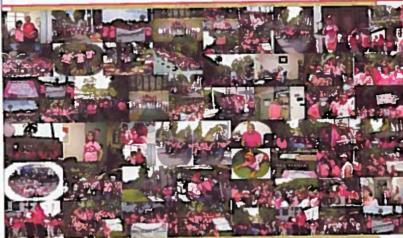
EDFI dice presente Marcha por una causa - Cáncer del Seno

¡¡¡No te puedes perder la parte final de este abstracto en nuestra tercera edición (enero 2014)!!!